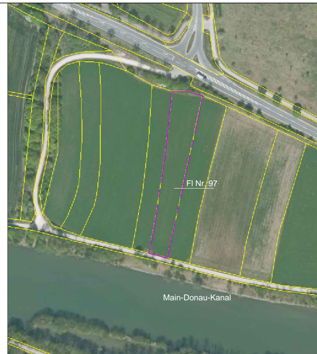
Luftbild M 1: 2000