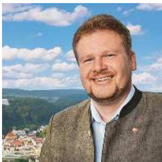
Siegfried Lösch Erster Bürgermeister Stadt Riedenburg

Im Namen der Stadt Riedenburg und des Touristikvereins Riedenburg wünschen wir Ihnen einen angenehmen und erholsamen Aufenthalt!